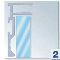
Pose du miroir