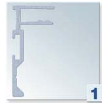
Pose du support