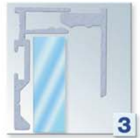
Pose du clip